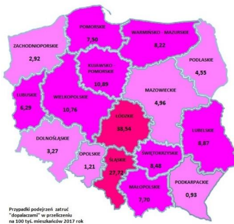
Dane z Państwowej Inspekcji Sanitarnej w sprawie dopapalaczy z roku 2017