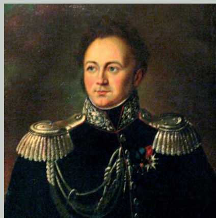
Generał wojsk polskich Ignacy Pantaleon Prądzyński herbu Grzymała

wał w kampaniach napoleońskich, był też budowniczym Kanału Augustowskiego. Gdyby wcielono w życie jego pomysły strategiczne, to kto wie, czy losy powstania nie potoczyłyby się inaczej, w opinii wielu historyków było ono bowiem militarnie do wygrania. Podczas drugiej fazy polskiej ofensywy, która prowadzi-